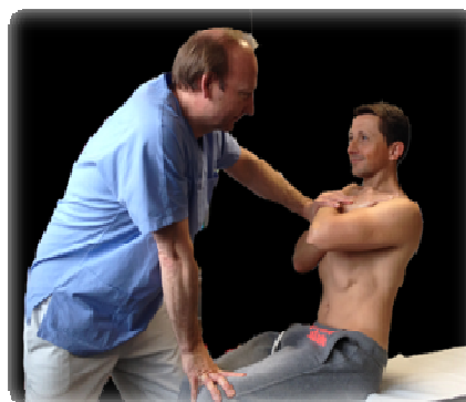
OPTIMIZE ATHLETES PERFORMANCES